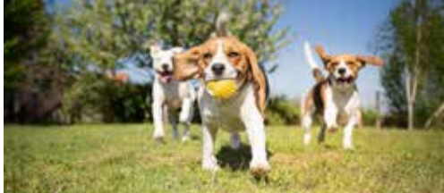
Reglement voor hondenlosloopzone p.2