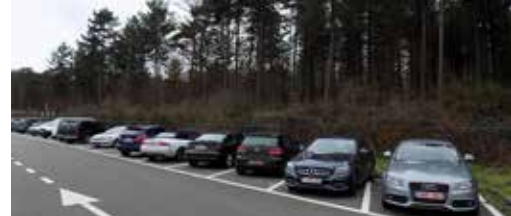
Voorwaarden voor doortrekkersterrein p.3